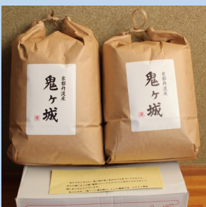
ご入会特典：庵我の新米10kg

ホームページ掲載写真を募集します。 テーマ：冬の庵我（景色やイベント） タイトルに「冬の庵我投稿」と記載いただきメールで送付ください。送付先：angaianga8@gmail.com