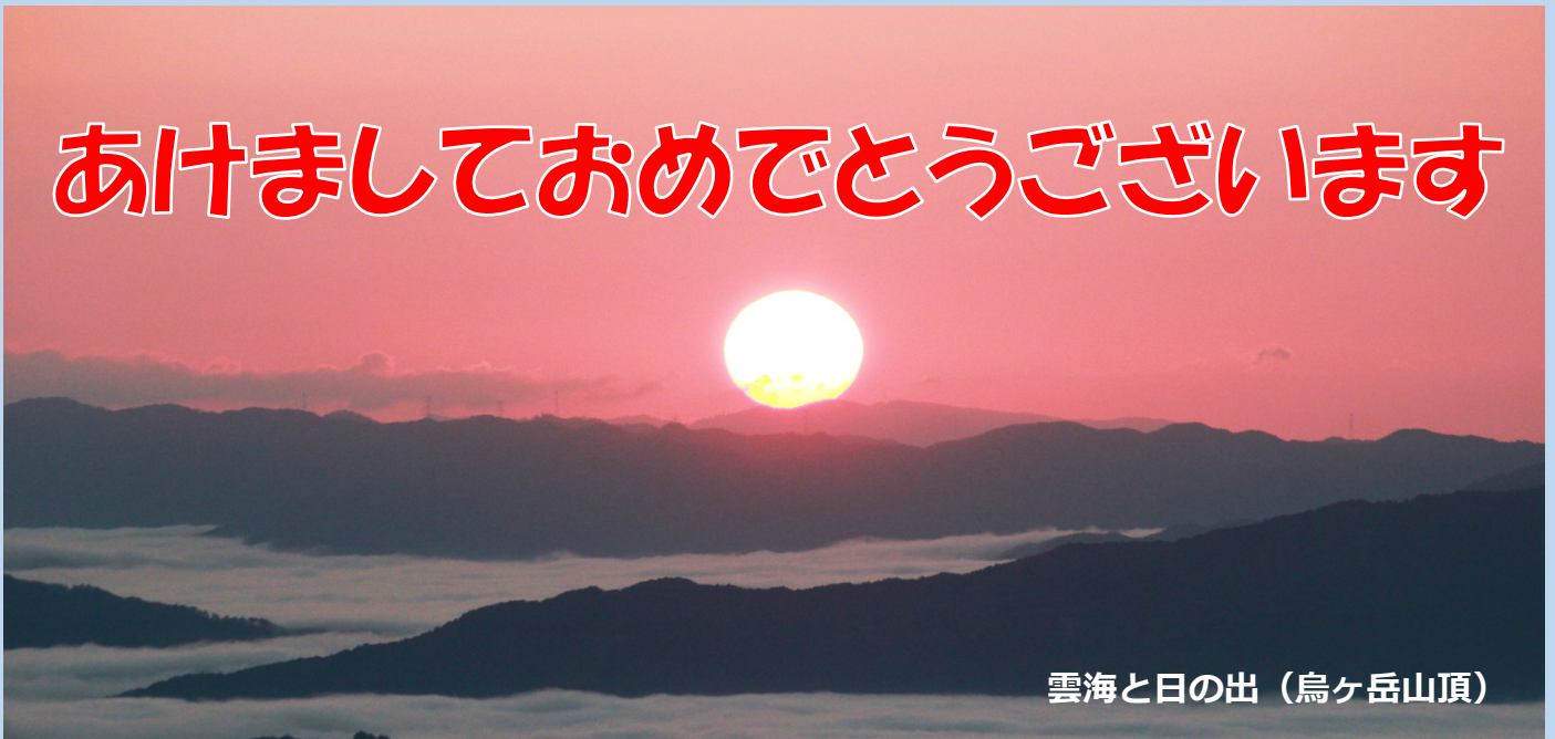
雲海と日の出（烏ヶ岳山頂）