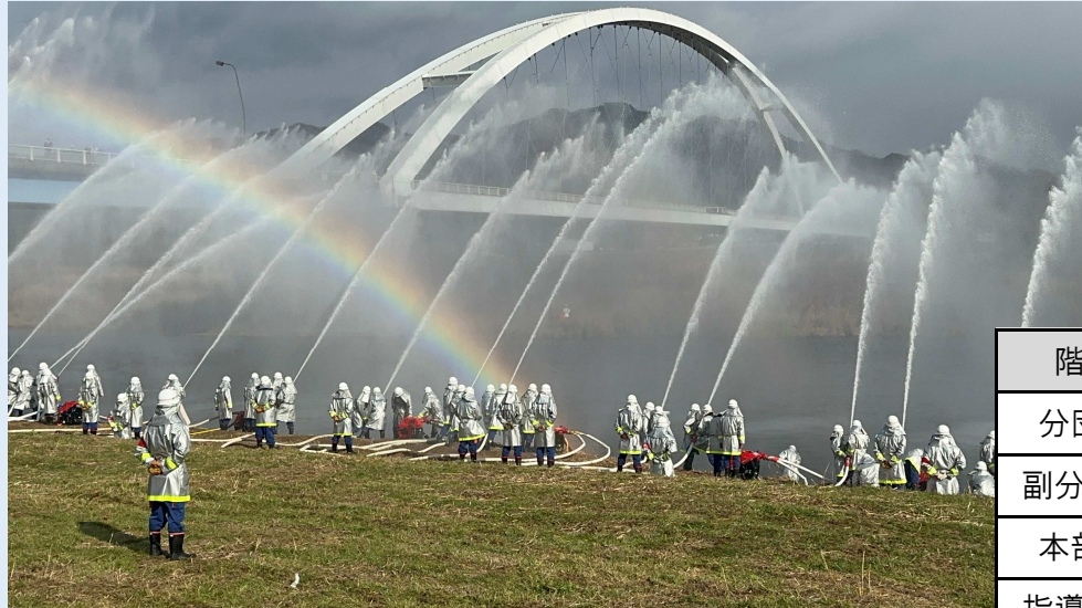
2024年出初の放水風景

水害から守るために、様々な訓練を計画的に実施されています。今回で最終回、本部と第1部 猪崎・城山・下猪崎・中村団地で活躍されている皆様を紹介いたします。（敬称略）