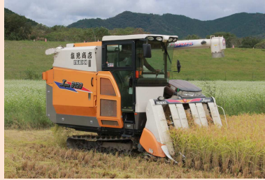
最新の大型コンバイン