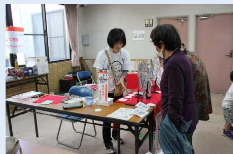
“笑い文字コーナー”では来場皆様に実体験いただきました。