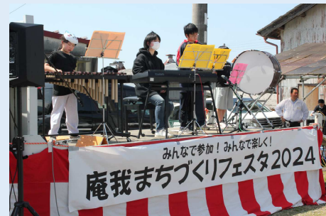
“庵我オーケストラ”による音楽演奏-その2-