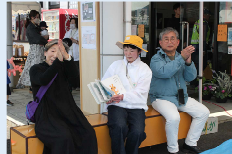
アンガハッピーメンバーによる絵本読み聞かせ-その2-