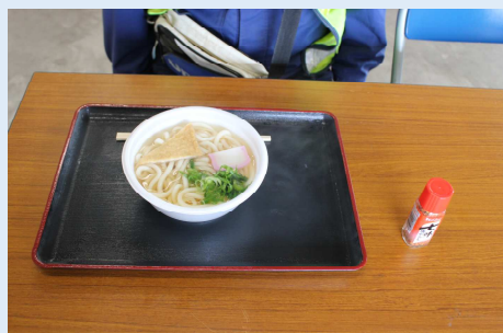
おいしいうどんは完売しました。