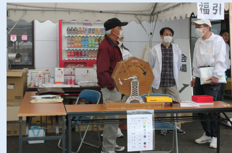
本部席テント周辺では福引きやウォークラリーなどの窓口設置。