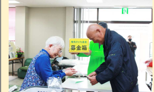
庵我子ども基金にご寄付いただきました