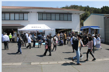
庵我会館前は人出でいっぱい。皆さんに楽しんでいただきました。