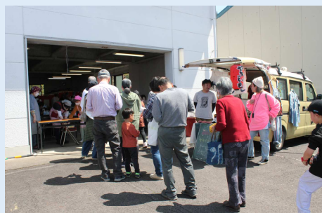
食事コーナーには行列も！