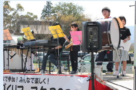
“庵我オーケストラ”による音楽演奏-その1-