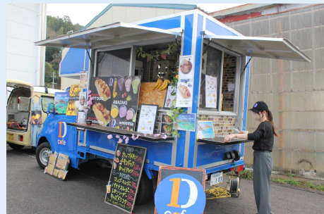
キッチンカーは“D1カフェ”と“ヤキイモマン”に来ていただきました。