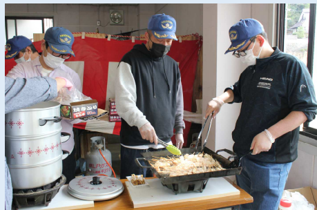
引換券対象の焼き鳥は高効率・大量生産手法を確立。

開催にあたっては、庵我地域関連団体の方々にも多大なご協力をいただきました。皆様ありがとうございました。