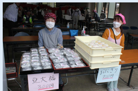
豆大福とおにぎり、たくさん用意しましたがこちらも完売です。