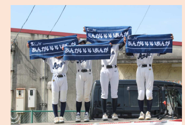
庵我子どもたちへのタオル贈呈

当日は会場において「庵我子ども基金」に多くのご賛同をいただき、80名以上の方々より10万円を超えるご寄付を頂戴しました。皆様のお気持ちを大切にさせていただき、ご寄付いただきました皆様、本当にありがとうございました。