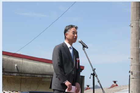
福知山市長大橋様来賓ごあいさつ。