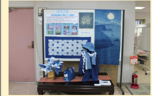
庵我会館1階事務所に展示