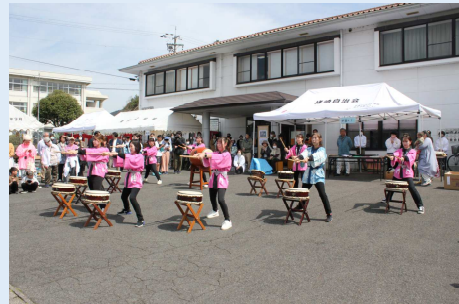
園児に続いて先生方からも素晴らしい演奏を聴かせていただきました。