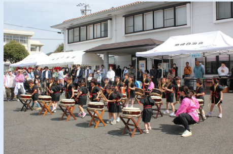
ひまわりこども園のかわいい園児による和太鼓演奏で式典スタート。