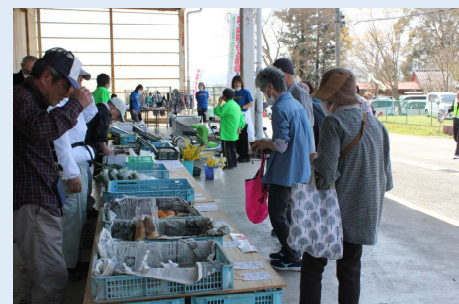
“野菜市”も人気、完売しました。