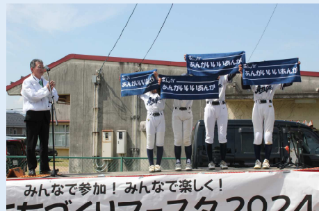
庵我会（福知山市職員）皆様からのご寄付で「庵我子ども基金」設立。