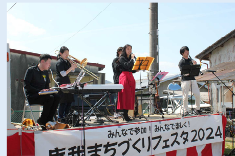
“オーケストラカレー”による音楽演奏