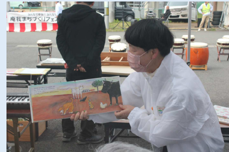
アンガハッピーメンバーによる絵本読み聞かせ-その1-