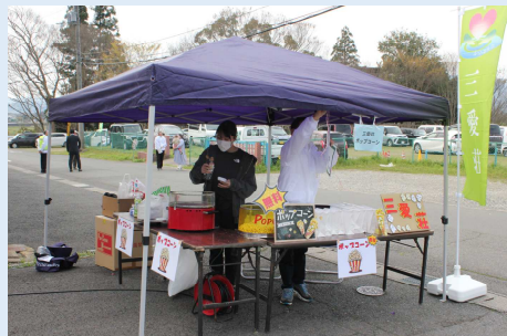
三愛荘さんからはポップコーン無料提供をいただきました。