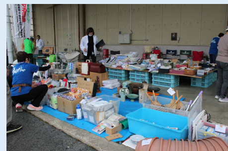
“フリーマーケット”は多くの商品で大盛況。